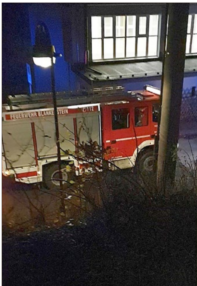
Mit Unterstützung durch die Freiwillige Feuerwehr fand unser alljährlicher Laternenumzug statt. Bei Einbruch der Dunkelheit schalteten die Kinder ihre mitgebrachten Laternen an. Begleitet

von Laternenliedern setzte sich der Umzug in Bewegung und war so schon von weitem zu hören und zu sehen. Wieder am Kindergarten angekommen, verkaufte unser Förderverein Wiener Würstchen, Knabberereien und verschiedene Getränke. Und so klang der Abend in gemütlicher Runde aus.