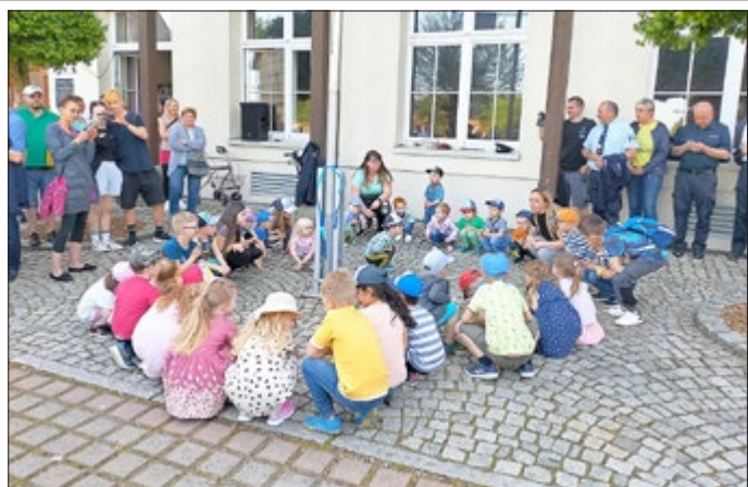
Eindrücke aus dem Kindergarten „Kuckucksnest“ im OT Blankenstein