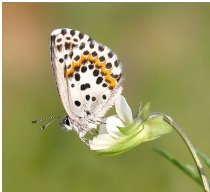
Fetthennenbläuling ( Scolitantides orion ), Unterloiben in der Wachau, Niederösterreich

Und nun noch ein Hinweis in eigener Sache. Kennen Sie den Fetthennen-Bläuling? Bis vor kurzem war dieser bedrohte Schmetterling mir noch kein Begriff. Die Stiftung Naturschutz, die das grüne Band bzw. die ehemalige innerdeutsche Grenze betreut, hat ein Vorkommen dieses Tagfalters bei uns in der Gemeinde entdeckt. Das besondere dabei ist, dass der Fetthennen-Bläuling auf der roten Liste steht und vom Aussterben bedroht ist. Sehen kann man ihn im Bereich unterhalb der Bastei, entlang der Pferdebahn. Und was hat das jetzt mit uns zu tun? Aufgrund der bestätigten Vorkommen dort ist es uns untersagt, im Frühjahr und Sommer diesen Bereich zu mähen, damit der Bläuling genügend Blühpflanzen als Nahrung vorfindet. Es ist also kein böser Wille, wenn dort das Gras etwas höher steht als üblich, sondern wir dürfen dort nichts verändern.